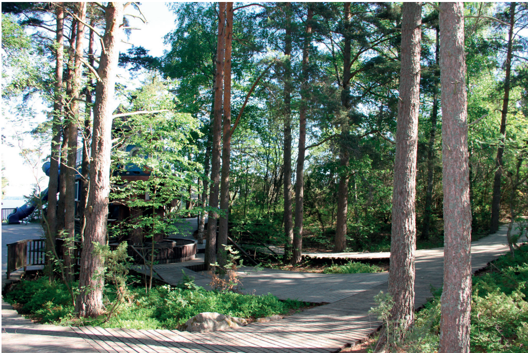
Muumimaa-aidattu alue on mäntyvaltaista kalliomaastoa

Selvityksen maastotöistä vastasi FM, biologi Jyrki Matikainen Suomen Luontotieto Oy:stä. Raportin taittoi Eija Rauhala (tmi Eija Rauhala). Selvityksessä käytetyn karttamateriaalin luovutti tilaaja käyttöömmee. Ennen maastoinventointia selvitettiin onko alueelta olemassa aiemmin julkaistua luontotietoa. Aluetta on tutkittu laajempien selvitysten yhteydessä (mm. Lehtomaa 1998) sekä myös erilliselvityksenä v. 2002 (Biota Oy).