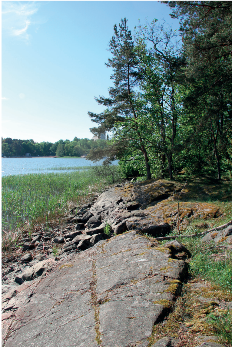
Lohkon 2 kallioista rantaviivaa

Lohko käsittää Muumimaailman aidan ja rannan väliin jäävän alueen, jonka poikki kulkee saaren pohjoiskärkeen kulkeva ulkoilureitti. Alue on harvapuustoista ja rannan puolelta osin myös kallioista. Puusto muodostuu ylispuina kasvavista kookkaista männyistä ( Pinus sylvestris ), muutamasta kookkaasta pihlajasta ( Sorbus aucuparia ) ja vaahterasta ( Acer platanoides ). Aluspuustona kasvaa runsaasti pihlajaa. Metsätyyppi on alueella paikoin oravanmarjatyyppin tuoretta kangasta ja paikoin lähinnä kuivaksi lehdoksi luokiteltavaa puistometsää. Aluskasvilisuuden valtalajistoon kuuluu mm. mustikka ( Vaccinium myrtillus ), oravanmarja ( Mainthemon bifolium ), metsälauha ( Deschampsia flexuosa ) ja paikoin myös valkovuokko ( Anemone nemorosa ). Pensaskerroksessa esiintyy pihlajan lisäksi taikinanmarjaa ( Ribes alpinum ), lehtokuusamaa ( Lonicera xylosteum ) sekä orjanruusua ( Rosa dumalis ). Rannanpuolella kasvaa heikkokuntoinen iharuusu ( Rosa mollis ). Rantaa reunustaa kapea tervaleppää kasvava reunus lähellä tenniskenttää, mutta valtaosa rannasta on kallioista ja melko niukkasvuista. Rantavyöhyke on melko kapea ja rannan putkilokasvilajisto on niukkaa. Lajistoon kuuluu mm. meriputki ( Angelica archangelica ssp. litoralis ), rönsyröllli ( Agrostris stolonifera ) ja ruokohelpi. Lohkon alue on monin kohdin melko kulunutta.