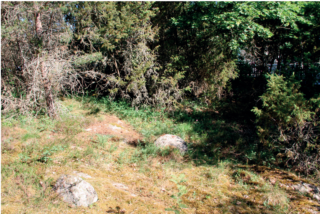
Lohkon 6 katajaketo luontotyyppi on itäreunaltaan umpeutumassa

Lohko käsittää varsinaisen aidatun ja rakennetun Muumimaailma-alueen. Alue on kallioista, mäntyä kasvavaa mustikkatyyppin kangasta, jossa kasvilajisto on kuitenkin osin kulttuurivaihteista. Alueella risteilee katettujen polkujen verkosto, joka ohjaa hyvin kulkemista ja kasvillisuus on polkujen ja rakennusten välissä melko hyvin säilynyttä. Vain muutamien kohtien alueella on hieman kuluneempia kohtia. Alueelle on istutettu jonkin verran puutarhalajeja kuten erilaisia ruusuja. Muutamien kohtien alueella kasvaa pylväskatajia ja rehevimmissä kohdissa myös yksittäisiä vaahteroita. Alueella on muutamia vanhempia mäntyjä, mutta muuten puusto ei ole erityisen vanhaa. Lahopuut ja pudonnet oksat ja tuulenkaadot on alueelta korjattu pois. Alueen rakennukset on sovitettu ympäröivään metsään hienosti.