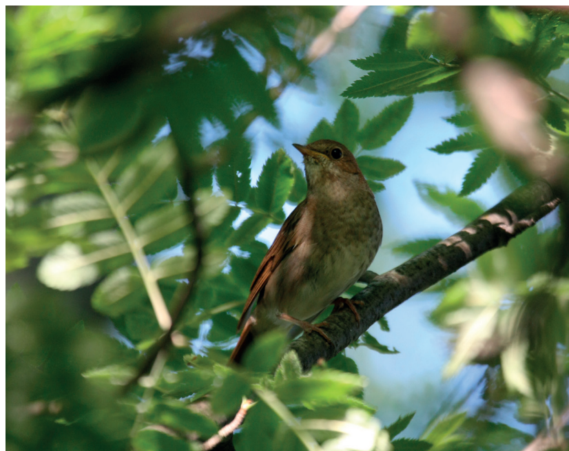
Satakieli kuuluu alueen pesimälinnustoon

Suunnittelualueen pesimälinnusto selvitettiin kartoituslaskentamenetelmällä kahta käyntikerää käyttäen 22.5. ja 8.6. Maastotöistä vastasi ja raportin kirjoitti biologi FM. Jyrki Matikainen.