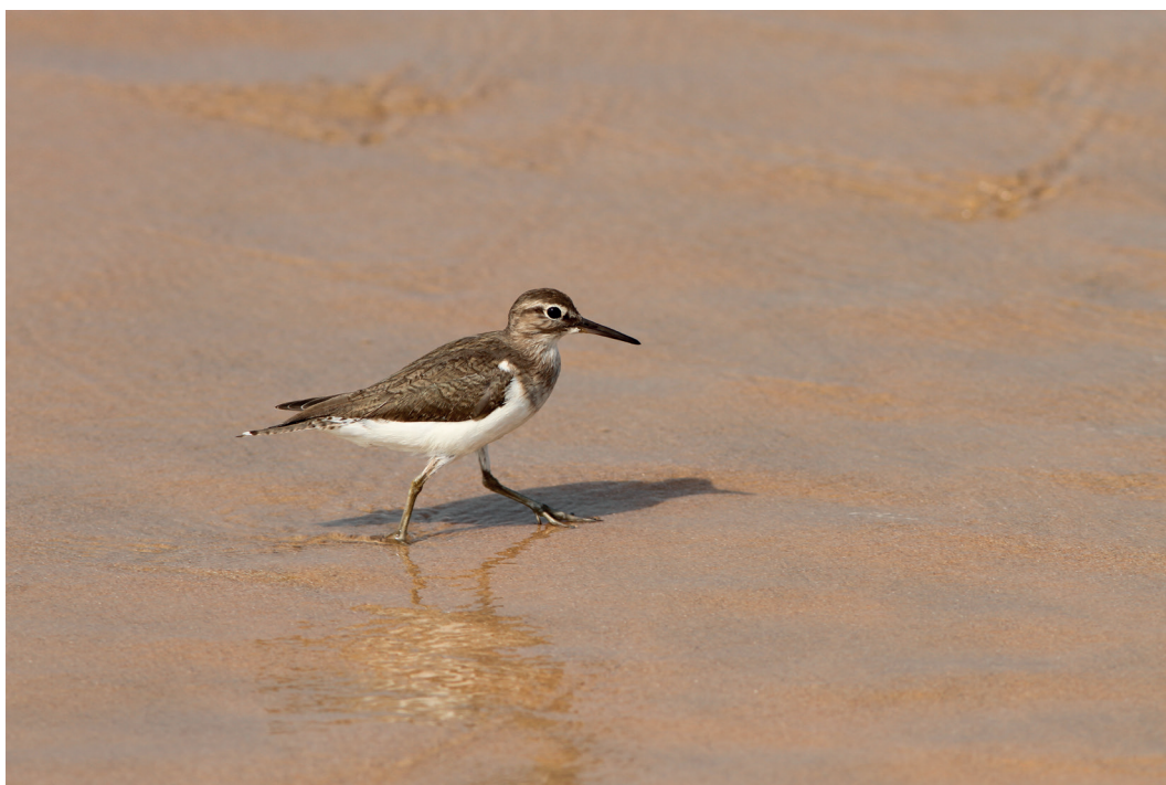
Alueella oli rantasipireviiri

Uimarannan alueella havaittiin ensimmäisellä laskentakerralla rantasipi, jonka käyttäytyminen viittasi pesintään. Lajin pesä sijaitsee usein kaukana vedestä ja se sijaitsee usein kuivalla kumpareella tai aukion reunassa. Poikueet tuodaan varttumaan kosteikkoalueelle tai rantavyöhykkeeseen. Lajin pesintää ei saarella varmistettu.