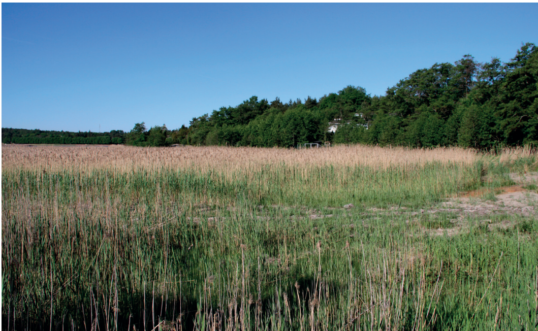
Lohkon 1 ruovikkoa

Kailon saaren eteläosaa reunustaa melko leveä ruovikkoreunus ( Phragmites australis ), joka on osittain syntynyt ruoppausläjityksen seurauksena. Yhtenäisen ruovikon ja rannan väliin jää paikoin kapea suurruohoniittyreunus, jossa valtalajisto muodostuu mesiangervosta ( Filipendula ulmaria ) ja ruokohelvestä ( Phalaris arundinacea ). Rannan puolella lohkoa reunustaa kapea tervaleppälehtoreunus ( Alnus glutinosa ), joka sekin on epäyhtenäinen. Lohkon pesimälinnustoon kuuluu ruokokerttunen (2 paria), pensaskerttu (1 pari) sekä pajusirkku.