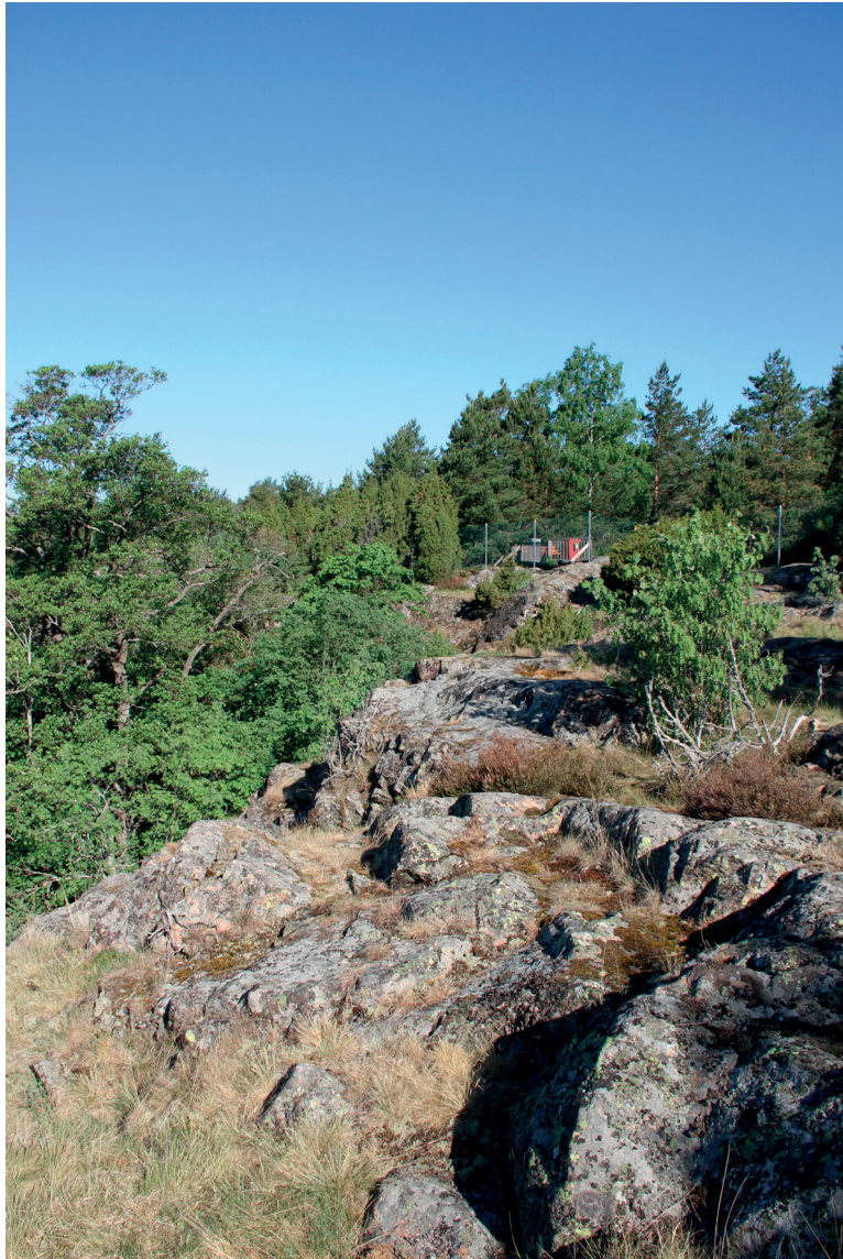
Yleiskuva lohkon 5 jyrkänteen yläpuolelta

Muumimaailman aidan länsipuoleinen alue on harvapuustoista kallioaluetta, jossa kasvaa mäntyä ja notkelmissa myös pihlajia. Alueen pohjoisosa on harvaa mäntyä kasvavaa niukkalajista kallioaluetta. Alueen keskiosassa on laaja, aitaan rajautuva, melko niukkalajinen avokalliolaikku, mutta lohkon eteläosassa, jossa avokalliolaikut ovat pienempiä, kallioiden putkilokasvilajisto on runsaampaa ja alueella on kallioketoa. Edustavin kallioketo sijaitsee jyrkässä rinteessä, jonka puolivälissä on kapea terassimainen alue, jossa kasvaa mm. sikoangervoa ( Filipendula vulgaris ), haurasloikkaa ( Cystopteris fragilis ), mäkitervakkoa, lituruohoa ( Arabidopsis thaliana ), hietalemmikkiä ( Myosotis stricta ) ja keto-orvokkia ( Viola tricolor ). Näiltä kohdin on hienot näkymät saaren länsipuolelle Kultarannan suuntaan. Jyrkänte on metsälakikohde, mikäli alue olisi asemakaavoittamaton ja metsätalouskäytössä.