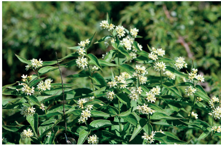
Käärmeenpistoyrtti kuuluu saaren kasvilajistoon

Tenniskentän pohjoispuolen ja uimarannan itäpuoleinen alue on rehevää lehtoa, jossa kasvillisuudessa näkyy kulttuurivaikutus. Tenniskentän reunamilla aluskasvillisuuden valtalajina kasvaa mustikka, lillukka ( Rubus saxatilis ) ja paikoin myös kielo ( Convallaria majalis ). Aivan tenniskentän reunassa on kapea rehevöitynyt ketolaikku, jossa kasvaa mm. mäkitervakkoa ( Silene viscaria ), pukinjuurta ( Pimpinella saxifraga ) mutta valtalajina on kuitenkin koiranputki ( Anthriscus sylvestris ). Uimarannan alueella on tervaleppävaltaisia, pienialaisia, polkujen väliin sijoittuvia tervaleppäkuvioita, jossa aluskasvillisuus on hyvin rehevää ja kulttuurivaltaista. Valtalajistoon kuuluu mm. mesiangervo ja paikoin myös koiranheinä ( Dactylis glomerata ). Nämä alueet ovat jonkin verran kuluneita ja uimarannan alue on lehtomaista puistometsää. Pensaskeroksessa kasva runsaasti tuomea ( Prunus padus ), vadelmaa ( Rubus idaeus ), mustaherukkaa ( Ribes nigrum ) sekä lehtokuusamaa. Tervaleppälehdon alueella kasvaa myös jonkin verran hiirenporrasta ( Athyrium filix-femina ).