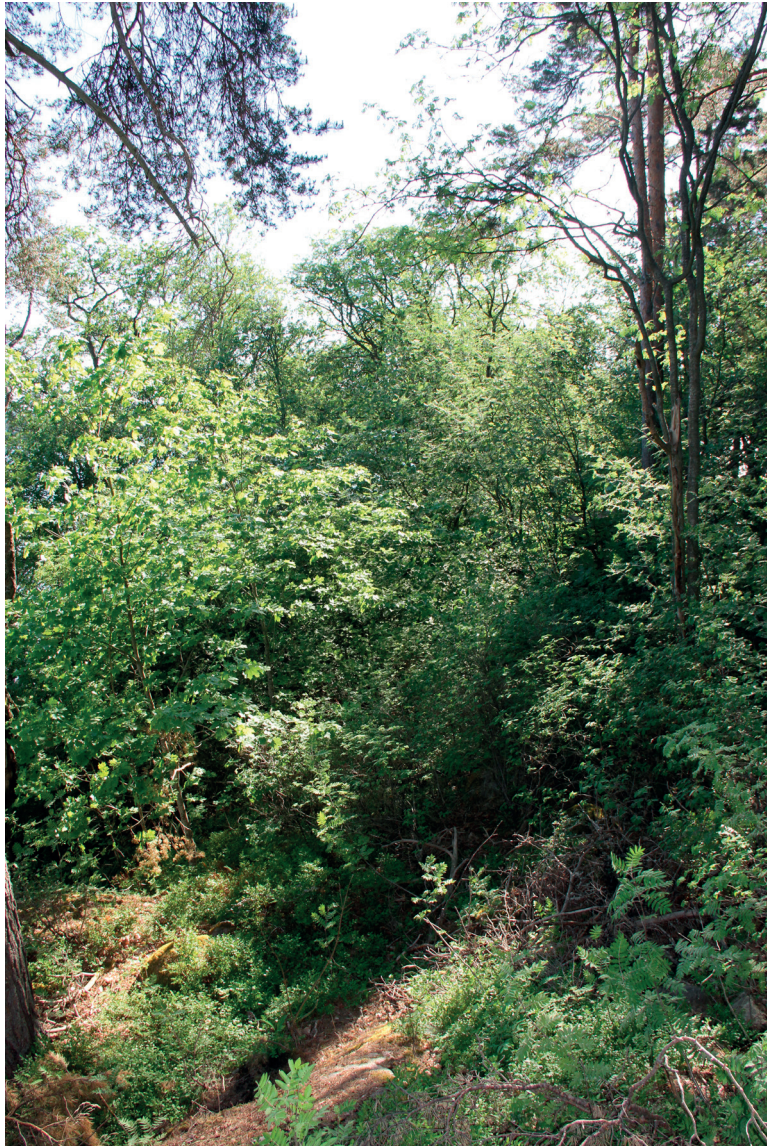
Lohkon 4 itärannan tiheää pensaikkaa

Saaren pohjoisosassa on kallioinen mäki-alue, jossa on myös muutama pieni jyrkänne. Lohkon keskiosassa on huvilarakennus, rannassa sauna ja alueella risteilee polkuja. Osa alueesta on melko kulunutta. Muutamin kohdin alueen kalliolla kasvaa kallioketojen lajistoa kuten kalliokieloa ( Polygonatum odoratum ), keltamaksaruohoa ( Sedum acre ), isomaksaruohoa ( Sedum telephium ) ja ahosuolaheinää ( Rumex acetosella ), mutta pääosin kalliit ovat melko kuluneita. Niemen itäreunassa on hyvin tiheä, tuomea, pihlajaa, lehtokuusamaa ja myös vaahteraa kasvava pensaikkoreunus, joka rajautuu rannan kapeaa tervaleppäreunukseen. Pensaikkoalueella on jonkin verran lahoavaa pientä lehtipuuta. Ylispuina pensaikon yllä kasvaa kookkaita mäntyjä. Erityisen kookas mänty kasvaa niemen tyvellä, lähellä uimarantaa.