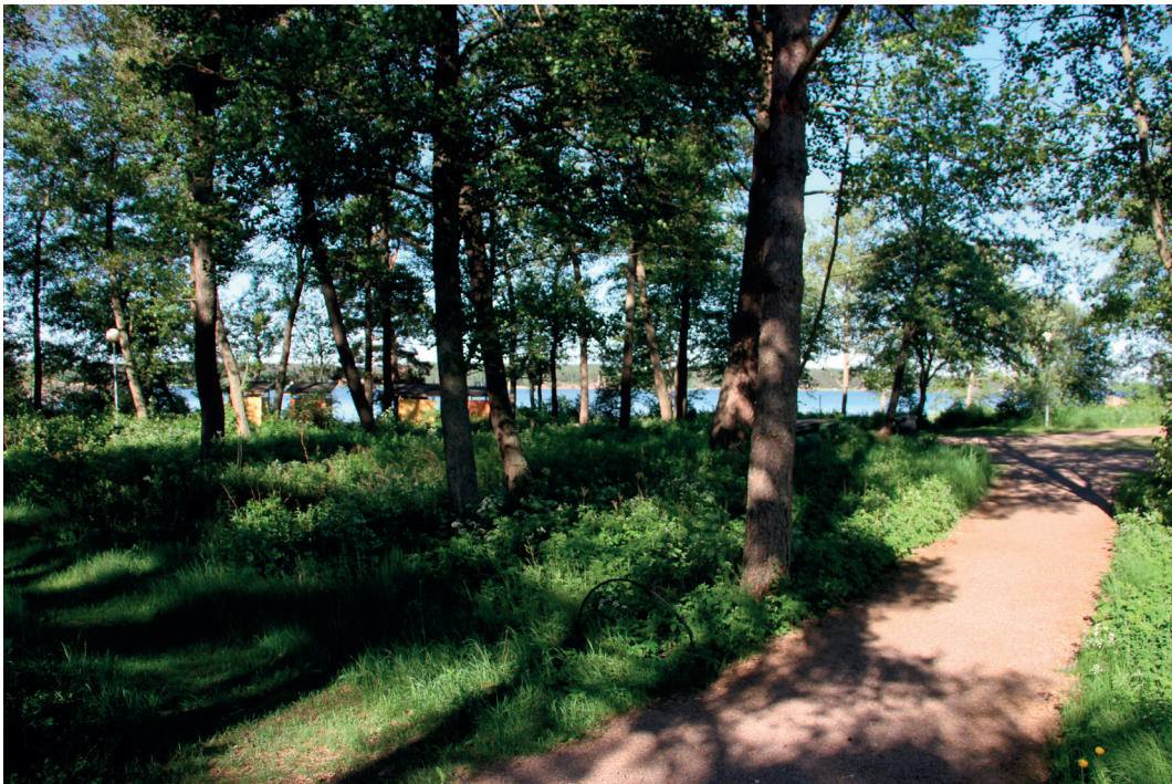
Yleiskuva lohkon 3 alueelta uimarannan suuntaan