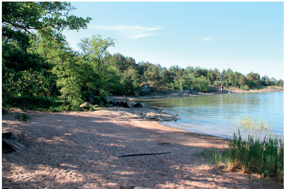
Yleiskuva uimarannalta Muumimaailman suuntaan