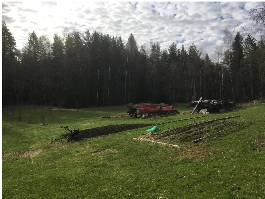
Nurmikenttää alueen itäosassa. Taustalla metsämaata.

Suunnittelualueella on melko tasaista nurmikenttää ja taustamaastossa hieman jyrkkäpiirteisempää metsämaata. Alue sijaitsee Matalahden etelärannalla. Suunnittelualueen maaperä on pääosin liejusavea sekä savea. Alueen lounaisosassa on kalliomaata sekä aivan alueen itäosassa hiekkamoreenia. (Lähde: http://gtkdata.gtk.fi/maankamara/# )